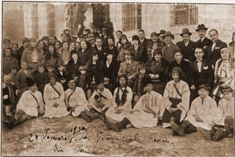
Gimnaziul din Ianina. La o serbare școlară, profesorii și părinții elevilor, având în mijlocul lor pe Dl. C. Burileanu, consulul României la Ianina.

3. Gimnaziul din Ianina. Școala secundară din Ianina a fost înființată în anul 1887. La început a funcționat ca școală elementară de comerț, iar mai târziu a fost transformată în gimnaziu. Actualmente funcționează cu 3 clase gimnaziale