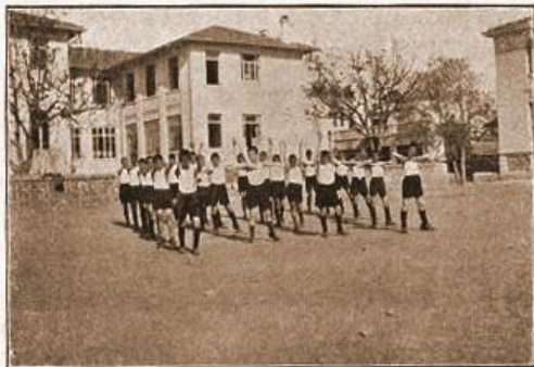
Școala superioară de Comerț din Salonic

Ca program de învățământ se aplică programul analitic și regulamentul școlilor din țară, cu singura deosebire că se adaugă, în plus, câteva ore săptămânal de limba greacă, istoria și geografia Greciei precum și o oră de istoria Aromânilor